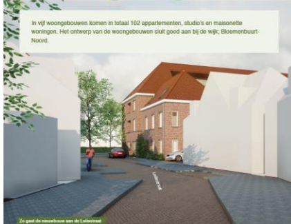
Zij geeft de nieuwbouw een de Leestraat en uit zijn vanaf het Bloemenbuurt (1)