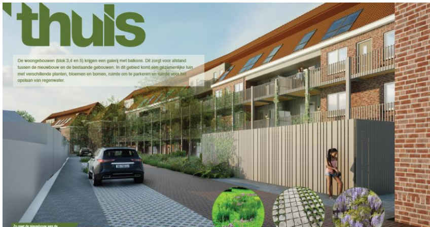
Zij geeft de nieuwbouw een de gemeentelijke bestemming voor deze