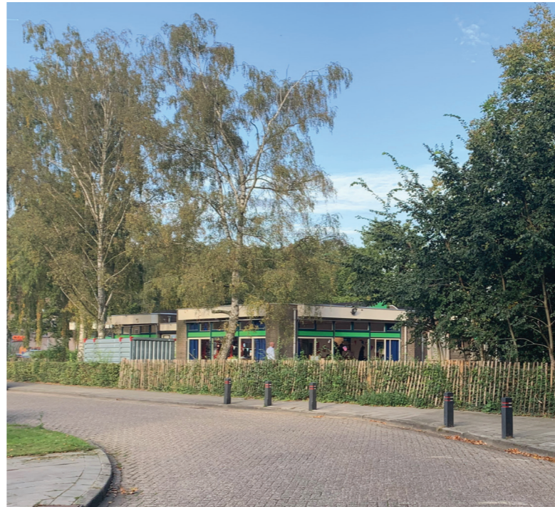
Van Gentlaan 4

We hebben verschillende vragen en zorgen gehoord over privacy, parkeren, groen en veiligheid.