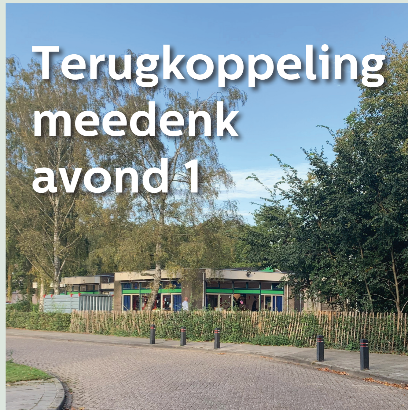
Locatie Van Gentlaan 4

Op 15 november was de eerste meedenkavond over de ontwikkelingen voor de locatie Van Gentlaan 4. We ontvingen die avond 24 buurtbewoners.