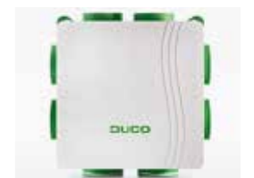
Ventilatiebox met CO 2 -sensor voor verse lucht